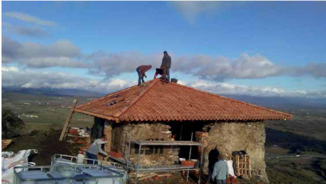
SAN BITOR. Además de ermita, el antiguo Castillo de Zaitegi sirve como refugio montañoso desde el que se contempla una espléndida panorámica de Zigoitia, entre Arrato y Gorbeia.

Etxaguen celebra su romería en La Magdalena