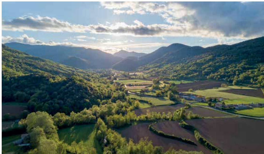
Panorámica de La Vall d'en Bas.

Se trata de una propuesta del grupo Gure Esku Dago Zubigoitia y ha sido aprobada por la corporación municipal