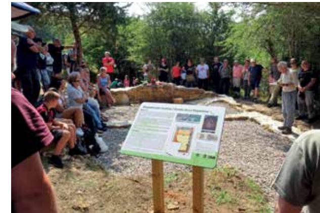
Etxaguen, que siguió los trabajos con gran interés y apoyo, celebró una animada romería en la fiesta de la Magdalena.

La hermandad de Zigoitia llegó a contar con más de 40 ermitas en sus diecisiete pueblos. Construidas entre los siglos XVI y XVII, se conservaron varias de ellas hasta el s. XX. Ante su progresivo abandono, se optó por la demolición de la mayoría. Actualmente se mantienen la emblemática Santa Lucía de Teparua, en Ondategi; San Bartolomé, en Manurga (recientemente restaurada); San Pedro de Gorostiza; San Roke, en Gopegi (reedificada hace unos años); San Antonio de Murua (que fue ermita y ahora es parroquia de este pueblo), San Esteban, en Etxabarri Ibiña y las recién recuperadas Santa María Magdalena del Yermo y San Bitor.