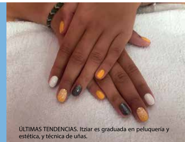
ÚLTIMAS TENDENCIAS. Itziar es graduada en peluquería y estética, y técnica de uñas.