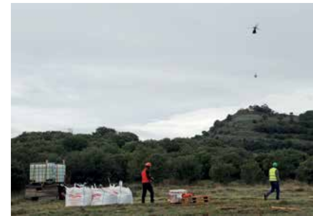
Un helicóptero transportó los materiales ya que el acceso no es apto para vehículos.

En esta ermita, así como en su fuente sanadora cercana -que ayudaba a que los niños y las niñas "rompiesen a hablar" bebiendo su agua- se entremezclan creencias subyacentes en el inconsciente colectivo unidas a las cristianas dominantes en la época, expresadas en la religiosidad popular. En efecto, este lugar, solitario y vacío -yermo, hermua, desierto- poseía un carácter 'sagrado' y evocaba los misterios del bosque donde viven, según la mitología, lamiak, sorginak, basajaun y Mari, el genio femenino de la mitología vasca. Estas creencias y sus ritos fueron luego cristianizados con santos y santas; en este caso, Santa María Magdalena cuya imagen, de finales del s. XVI, se conserva en la parroquia de Etxaguen.