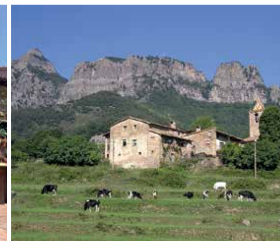
Los pueblos de Hostalets y Joanetes.

metros de altitud y desde el que se puede disfrutar de magníficas panorámicas sobre buena parte de Catalunya.